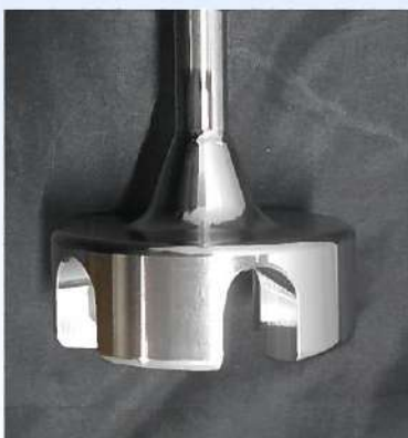
特許第6169207号 攪拌用回転体および攪拌装置

攪拌子は、特許ベルヌーイ流攪拌体 BEAG 。 沈殿物を吸い上げ、浮遊物を吸い込む 強力 な 攪拌が得意です。 羽根が無い ので安全。 穴が無い ので液切れ・洗淨が 簡単 确实。 高粘度・硬い固形物 にもお使いいただけます。